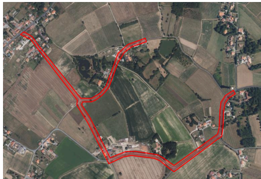
Emprise complète du projet