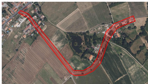
1ère phase débutant le 4 novembre 2024